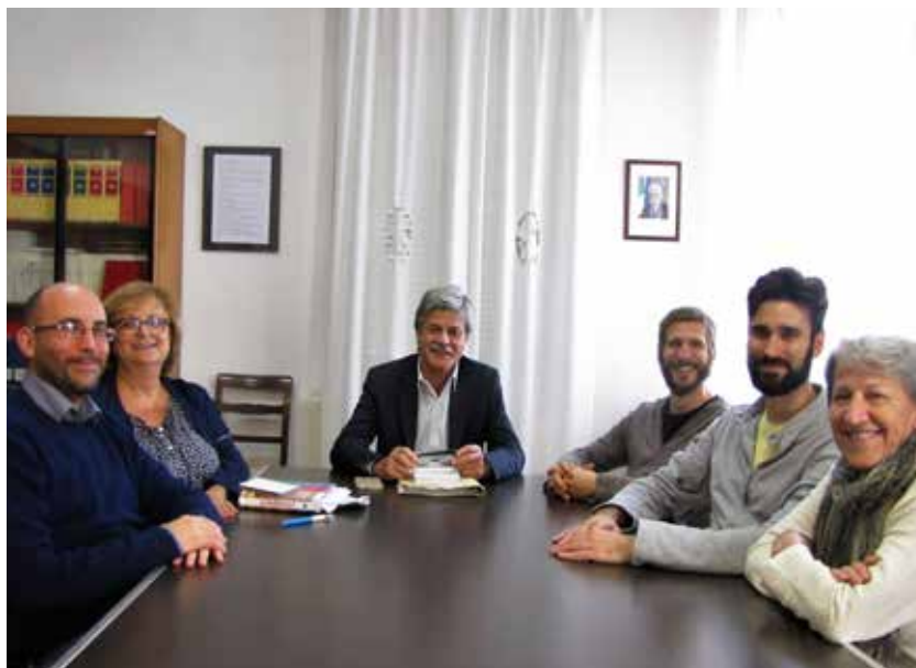
La Giunta Comunale

Qui va ricordato anche l'ampliamento della System, azienda di fama internazionale che creerà circa 400 posti di lavoro qualificato e pulito, senza emissioni in atmosfera. A questa operazione e' collegata la realizzazione di un nuovo modernissimo e sicuro polo scolastico a Spezzano. Tutto ciò ha un costo, e cioè il sacrificio di suolo ora verde, che verrà occupato. Va considerato tuttavia che contemporaneamente avviene sul territorio comunale il recupero di altre zone prima impermeabilizzate. Va considerato il beneficio per le nostre famiglie derivante dal disporre di due scuole nuove e di una nuova palestra sicurissime sul piano sismico e pienamente efficienti