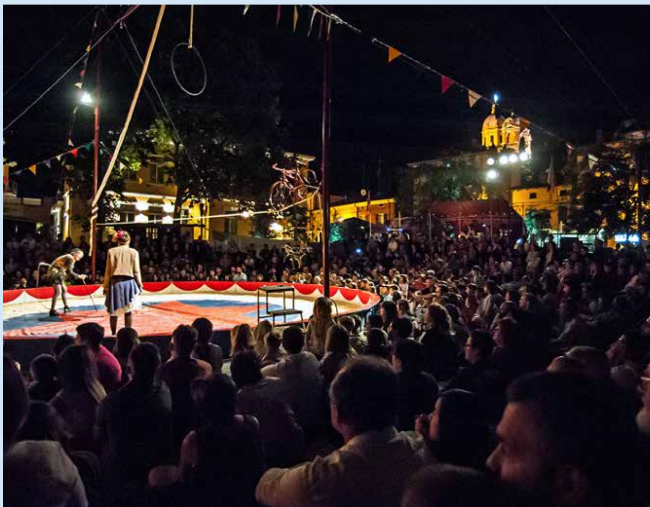
Le Cirque Bidon, proposto dall'associazione Dimondi Clown oltre che dall'amministrazione comunale, è rimasto nel cuore di tutti. Contiamo di riaverlo a Fiorano nel 2018.