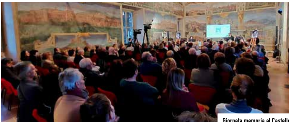
Giornata memoria al Castello