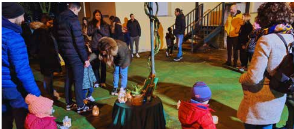
Venerdì 23 febbraio presso i nidi comunali si è svolta la "Notte dei Racconti" che ha affascinato adulti e bambini, coinvolgendoli in un'esperienza magica di lettura ad alta voce, anteprima di Reggionarra 2024.

Le DFC in seno all'Unione operano in modo coordinato e integrato tra loro, grazie a una progettazione condivisa con i soggetti promotori (Unione, AUSL, Associazione) che ha visto l'ideazione e la realizzazione di diverse iniziative finalizzate a sensibilizzare le persone, anche le giovani generazioni, al tema della demenza e dei disturbi di memoria, da quelle più specifiche (seminari, formazioni e convegni) a quelle di carattere ludico-culturale (feste, cinema, ecc.).