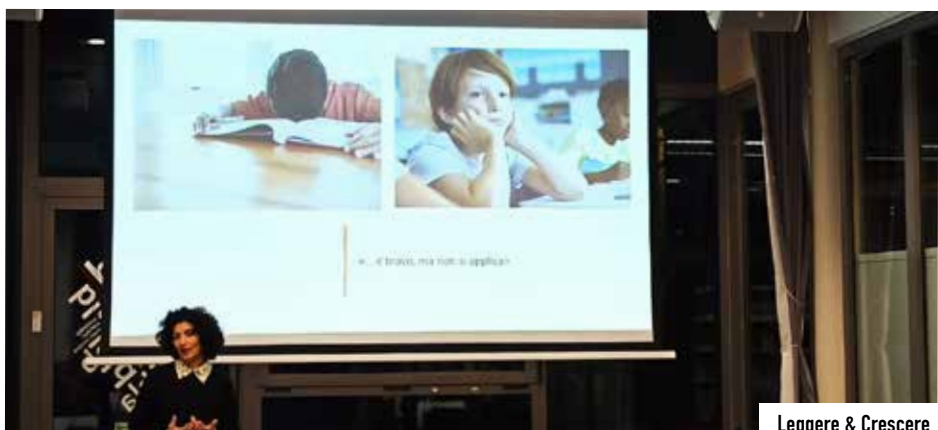
Leggere & Crescere