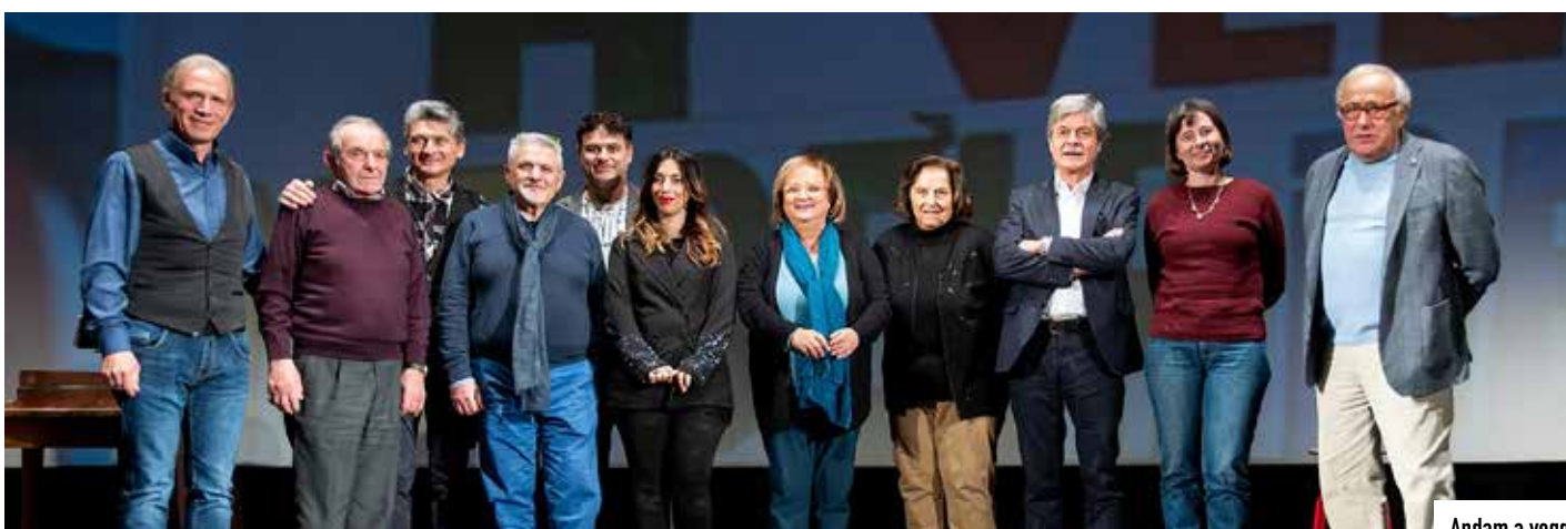
Andam a vegg

Il 2023 si è chiuso con gli eventi dedicati alle festività natalizie e, senza pausa, il nuovo anno è cominciato con nuove iniziative ludiche, ricreative e culturali.