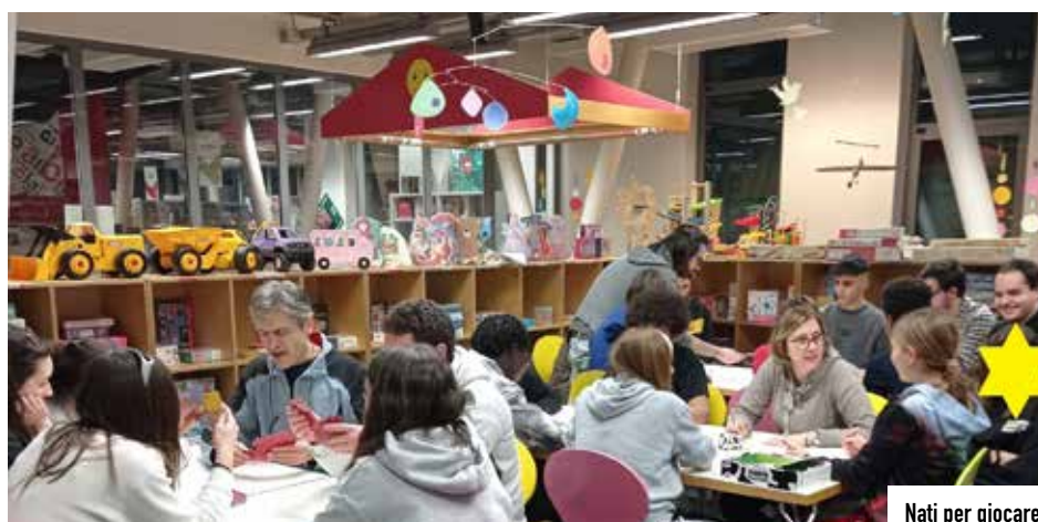
Nati per giocare