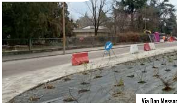
Via Don Messori