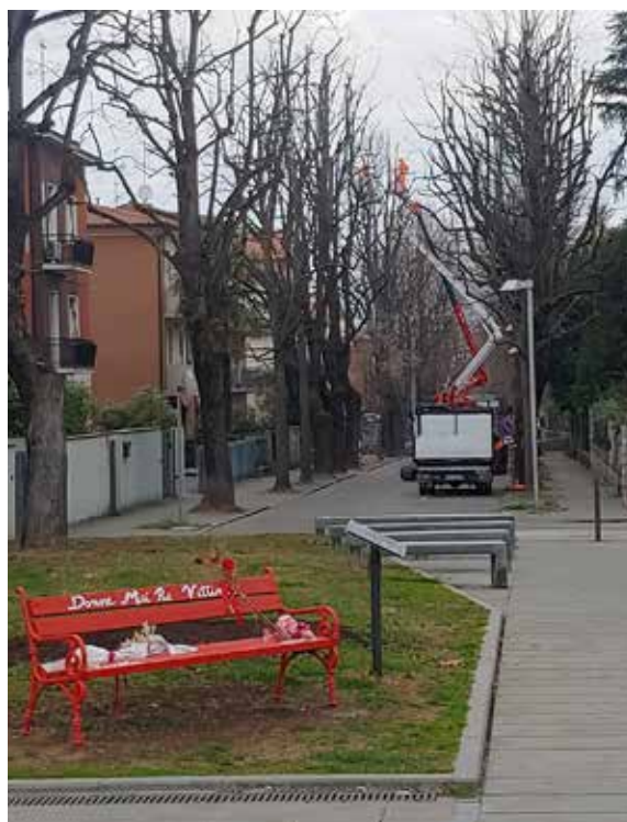
A febbraio la potatura dei quasi 100 alberi di via della Vittoria. L'intervento, atteso dai residenti, è costato circa 25.000.

Il progetto prevede la realizzazione di un nuovo svincolo sulla Pedemontana che permetterà ai mezzi pesanti di raggiungere direttamente gli insediamenti di Ubersetto, andando ad alleggerire ulteriormente il traffico nel centro. Questa operazione, che dovrà ottenere i permessi anche dalla Provincia, si affianca alla nuova bretellina via Canaletto - via Giardini nel progetto complessivo di riduzione del traffico pesante all'interno dell'abitato della frazione.