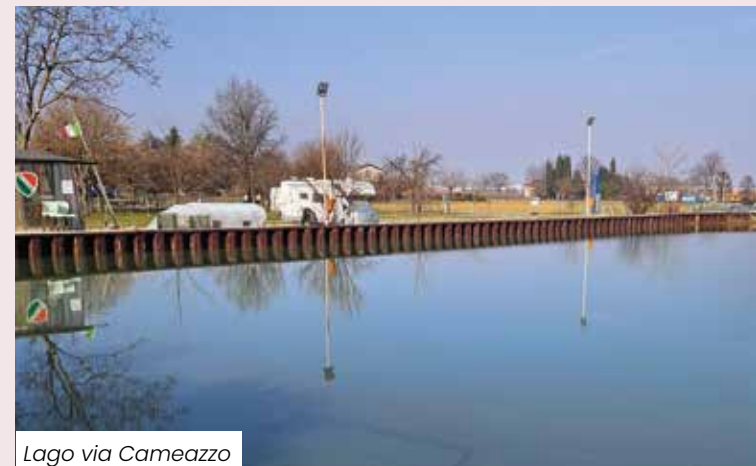
Lago via Cameazzo

• IMPIANTI SPORTIVI – Ugualmente, una significativa riqualificazione ha interessato gli impianti sportivi. Oltre alla realizzazione del modernissimo PalaMaglio , è stato acquisito dal Comune il campo parrocchiale della frazione di Ubersetto, e trasformato in un centro sportivo pubblico, con numerosi interventi e migliorie . Sul campo da calcio è stato apposto un manto sintetico performante e durevole, illuminato ora da quattro nuove torri-faro; a ciò si aggiunge la sistemazione degli spogliatoi e la creazione dell'area multisport. L'intervento aveva tra le finalità quella di far crescere la frazione dando un forte segnale di interessamento dell'Amministrazione a quest'area. A seguire, nuova illuminazione e campo sintetico an-