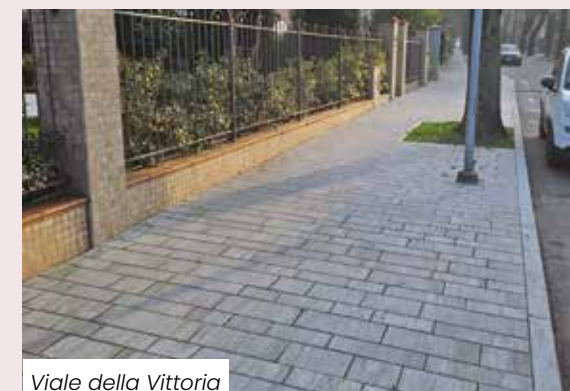
Viale della Vittoria

Quanto agli interventi strutturali riferiti alla viabilità, va primariamente ricordata la creazione di una nuova strada, compresa di pista ciclabile e rotatoria, che collega via Canaletto e via Giardini . L'opera è di indubbio rilievo sovracomunale e consente di evitare il passaggio nel centro abitato di Ubersetto, specialmente ai mezzi pesanti. I lavori, realizzati da privati a scomputo di oneri, stanno per essere terminati. Infine, per eliminare gli incroci semaforici sulla Circonvallazione sono state realizzate (considerando an-