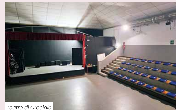
Teatro di Crociale