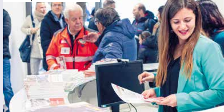
Nuovo Sportello del Cittadino

a compiere precise segnalazioni tramite i canali preposti. Complessivamente parliamo di oltre 11.400 accessi (circa 46 utenti al giorno in media) tramite URP, piattaforme call center, help desk. Attraverso l'app Rilfedeur , ad esempio, sono pervenute 1881 segnalazioni, l'80% delle quali ha trovato risposta nel corso dello stesso anno (+5% rispetto al 2022). Oltre all'aumento della capacità di risposta e alla riduzione dei tempi medi , le segnalazioni sono diventate motore di trasmissione rispetto ai principali strumenti di programmazione (asfalti, marciapiedi, verde, ecc.). Inoltre è stata attivata la piattaforma Help desk tale da permettere ad associazioni, scuole e società sportive di indicare guasti e malfunzionamenti. In ultimo è stato assicurato un miglior controllo dei servizi esternalizzati , attivando tavoli di lavoro permanenti su gestione rifiuti, servizi di spazzamento e pulizia strade, pulizia caditoie, guasti pubblica illuminazione.