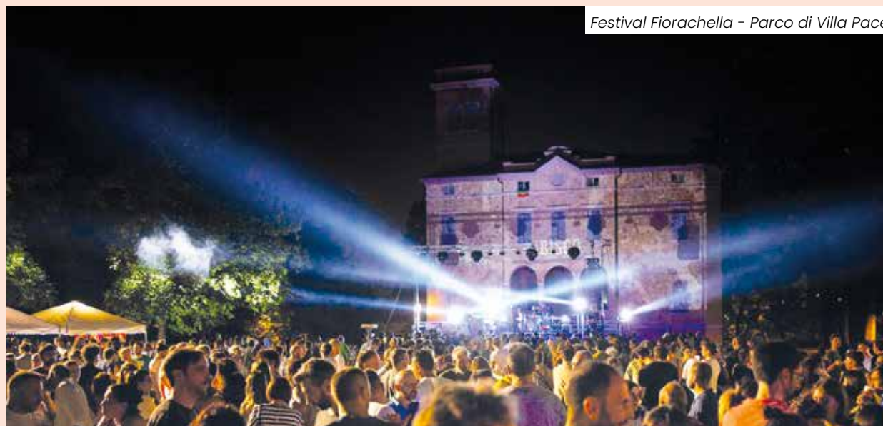
Festival Fiorachella - Parco di Villa Pace

I significativi contributi economici messi a disposizione delle associazioni hanno reso possibile una progettualità annuale orientata al perseguimento dell'interesse generale della comunità. Pensiamo al "Maggio" denominato "fioranese" da più di vent'anni, con Piazza Menotti che ne è platea e cornice, e con il Comitato Fiorano in Festa e le associazioni che, insieme all'Amministrazione, ne sono fautori e protagonisti. Pur nella longevità di questa caratteristica manifestazione, elementi di rinnovamento hanno contraddistinto il suo percorso, fino ad arrivare all'attuale Sempre Maggio Fioranese . Si tratta di eventi culturali inclusivi, realizzati negli spazi cittadini e dedicati a una pluralità di utenti , adottando una modalità diffusa in termini