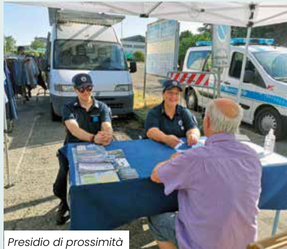
Presidio di prossimità

Proprio in quest'ottica l'Amministrazione ha scelto di ampliare, ad esempio, l'attività di educazione stradale che – a partire dal 2023 – è dedicata non più alle sole scuole elementari (16 classi) ma anche alle scuole materne (con 4 classi), per un totale di circa 400 piccoli studenti coinvolti. Allo stesso modo è stato avviato il progetto di Polizia di prossimità , il quale prevede la presenza di gazebo informativi ambulanti con agenti pronti a raccogliere le istanze dei cittadini e a rispondere a eventuali domande. Il progetto è finalizzato a migliorare sia il presidio sul