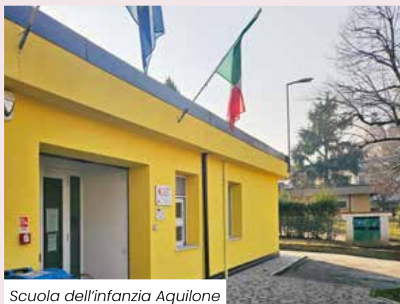
Scuola dell'infanzia Aquilone

ha visto importanti interventi antisismici e di efficientamento energetico; efficientamento effettuato anche per gli istituti Ferrari, Bursi e Guidotti. Presso queste scuole sono stati già sostituiti o programmati per l'estate 2024 gli impianti di illuminazione con luci a led. Numerose sono state le varie manutenzioni interne. Le scuole medie