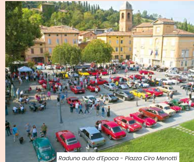
Raduno auto d'Epoca - Piazza Ciro Menotti

Dieci anni di collaborazione con i Comuni del Distretto Ceramico hanno permesso di ottenere risultati di grande rilievo in tema di turismo . L'ufficio Iat (Informazione e Accoglienza Turistica) del Sistema Turistico Territoriale Intercomunale (STTI) di cui Fiorano fa parte, ha acquisito il riconoscimento della Regione di Iat Reservation (Iat-R) dal momento che è disponibile il servizio di prenotazione ad esperienze turistiche acquistabili anche online. Proprio dal STTI ha preso avvio MaranelloPlus , portale web con relative pagine social che si occupa