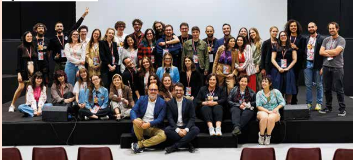
Organizzatori e volontari di EFF

nema Astoria ha proiettato oltre 100 premiere internazionali e un Premio Oscar . Negli anni, il Festival ha collaborato con enti pubblici, privati, fondazioni, associazioni, atenei (UNIMORE, UNIBO, Cattolica e UNIPR), e realizzato eventi con MIUR, Rai Radio Tre, MyMovies e altre realtà. Tutto questo è stato realizzato grazie alla possibilità di sperimentare e mettersi in