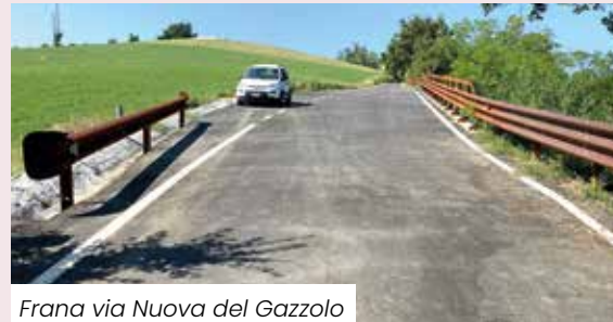
Frana via Nuova del Gazzolo

permesso il monitoraggio degli esemplari e la programmazione puntuale di interventi di potatura, difesa, terapia e messa in sicurezza. Nei casi estremi si è provveduto all'abbattimento, ma per ogni albero abbattuto è stato piantato almeno un altro esemplare, attività affiancata alla piantumazione di due alberi per ogni nuovo nato .