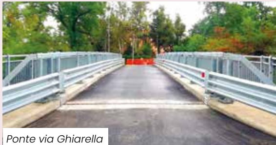
Ponte via Ghiarella