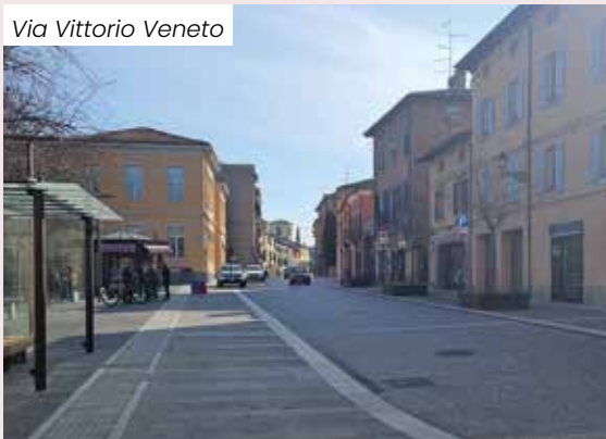
Via Vittorio Veneto

• ILLUMINAZIONE PUBBLICA – Una luce nuova è stata data all'intera Fiorano. Il precedente impianto, essendo obsoleto, causava frequenti guasti all'illuminazione pubblica. Pertanto, è stata effettuata la sostituzione degli oltre 4.000 punti luce con lampade a Led, procurando un considerevole risparmio di energia (somma che finanzia in buona parte l'investimento, oltre a essere uno degli obiettivi dell'Agenda ONU 2030) e minori costi di gestione. Apposti nuovi punti luce anche in zone in precedenza non illuminate e sono stati predisposti specifici impianti illuminotecnici per Piazza Menotti, per il Castello di Spezzano, per il Centro sportivo Menotti e per il Santuario.