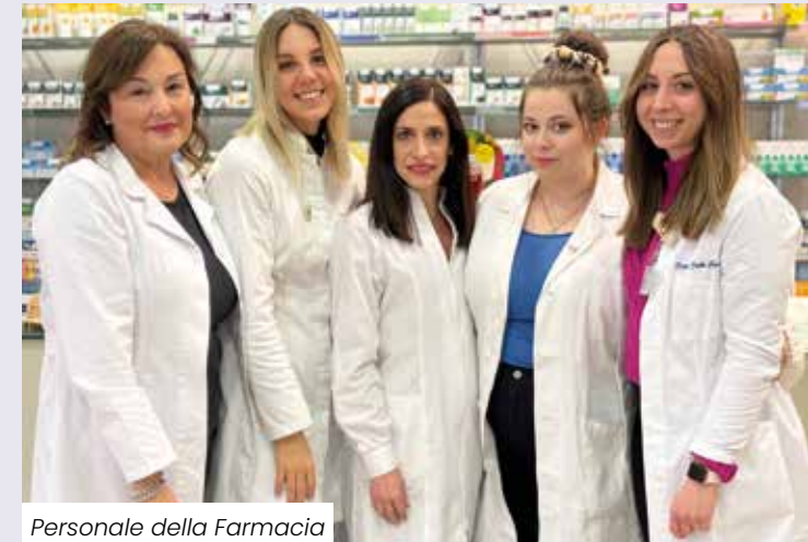
Personale della Farmacia

Altro obiettivo era quello di ottimizzare il funzionamento e ridurre i rischi di carattere finanziario legati alla società Fiorano