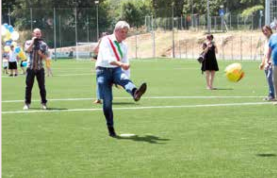
Campo Iseppi (Ubersetto)

che per il centro sportivo Ferrari , che da anni ospita diverse squadre e molte attività promosse dalle società del territorio. Per lo Stadio Sassi è stata effettuata la gara d'appalto per l'impianto di illuminazione che sarà del tutto rinnovato tramite la sostituzione degli imponenti punti luce, intervento già finanziato e in via di realizzazione. In ultimo citiamo il rinnovamento delle sponde del lago di Cameazzo , oltre alla nuova pista di atletica e al rifacimento in sintetico del campo Roccavilla, due opere eseguite durante la prima Amministrazione Tosi (2014-2019).