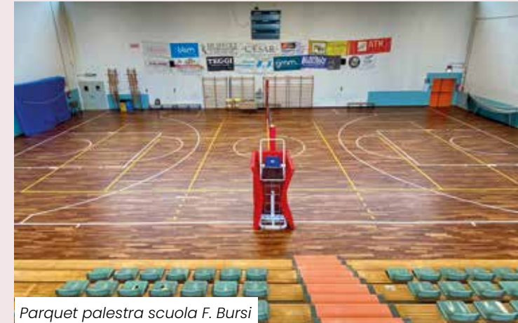
Parquet palestra scuola F. Bursi

• SCUOLE – Alla costruzione ex novo si sono affiancati importanti interventi di riqualificazione dell'esistente , dando opportuna rilevanza al tema dell' eco-sostenibilità ambientale . Ad esempio, per un importo di circa 135 mila euro, alle scuole Guidotti è stata rifatta una parte della copertura con materiali che garantiscono un ottimo isolamento, mentre per un importo di oltre 500 mila euro la scuola dell'infanzia Aquilone