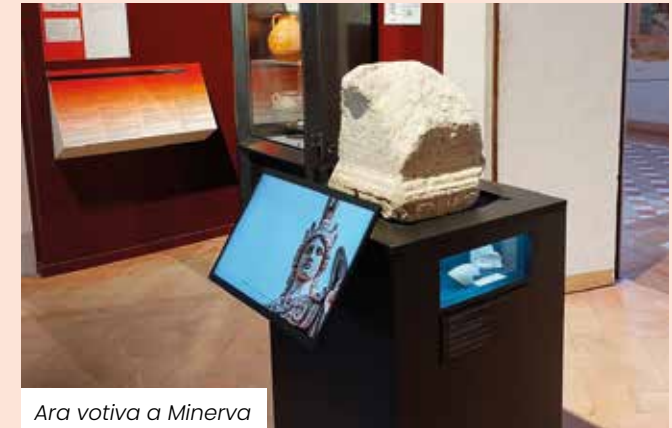
Ara votiva a Minerva

varietà dei generi proposti, all'alta qualità degli artisti, alla piacevolezza e alla magia del luogo, per una fruizione immersiva da parte di interessati e appassionati. Nel 2023 si è aggiunta la nuova offerta di Cinema estivo che ha trovato un'ottima accoglienza da parte del pubblico. Spostando l'attenzione dall'intrattenimento, ricordiamo lo studio rivolto alla Galleria delle Battaglie che come esito ha avuto la pubblicazione de La Galleria delle Battaglie nel Castello di Spezzano di Maria Teresa Sambin de Norcen. In ultimo, l'aceto prodotto presso l' Acetaia comunale all'interno del Castello ha ottenuto la certificazione DOP e altri riconoscimenti.