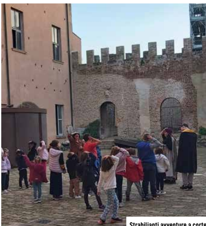
Strabilianti avventure a corte