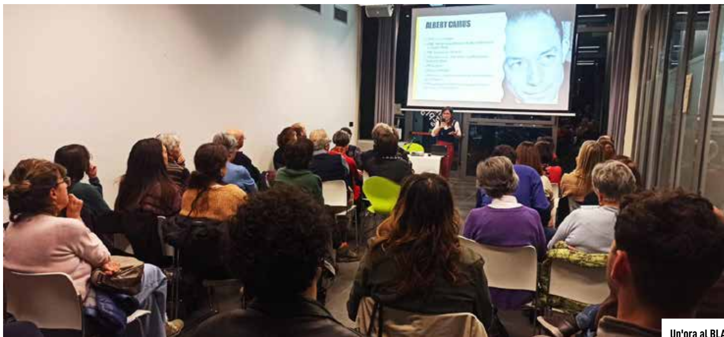
Un'ora al BLA

Grazie alla collaborazione con le associazioni del territorio