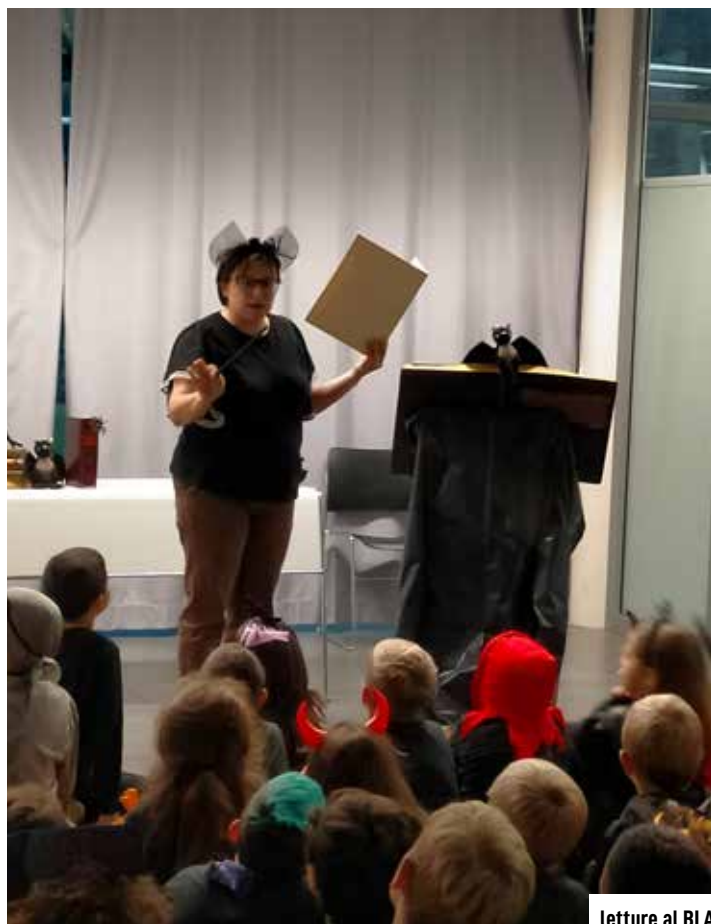
letture al BLA

Ora ci aspettano tanti appuntamenti in occasione delle feste natalizie, per ritrovarsi e stare insieme con gioia.