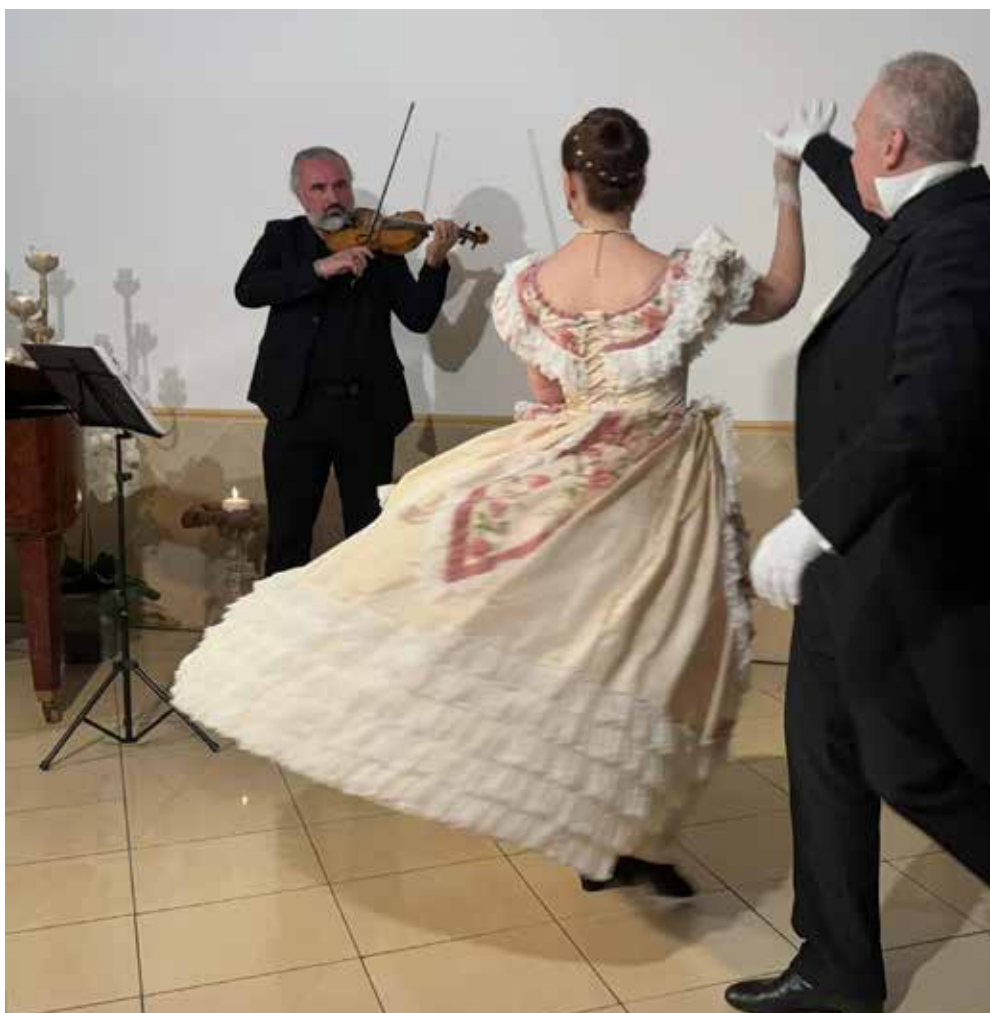
Valzer al Centro Via Vittorio Veneto

C on l'autunno riprendono le rassegne del BLA, da "Monografie" (quest'anno dedicata a Giorgio Bassani) a "In un'ora al BLA", ma è anche cominciata la stagione teatrale cinematografica del cinema teatro Astoria con artisti importanti e film novità.