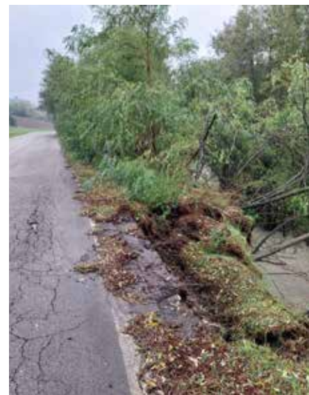
Via Nirano, altezza via Fiandri

Rio Chianca: nella zona di via Chianca n. 37 in corrispondenza di un ponticello, l'acqua ha esondato sopra al ponte e parte delle difese spondali esistenti sono crollate. Allagamento si sono verificati anche su via Riola.