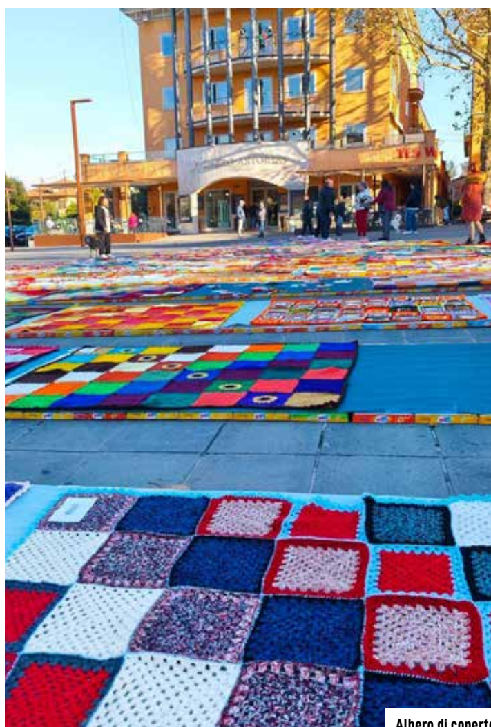
Albero di coperte