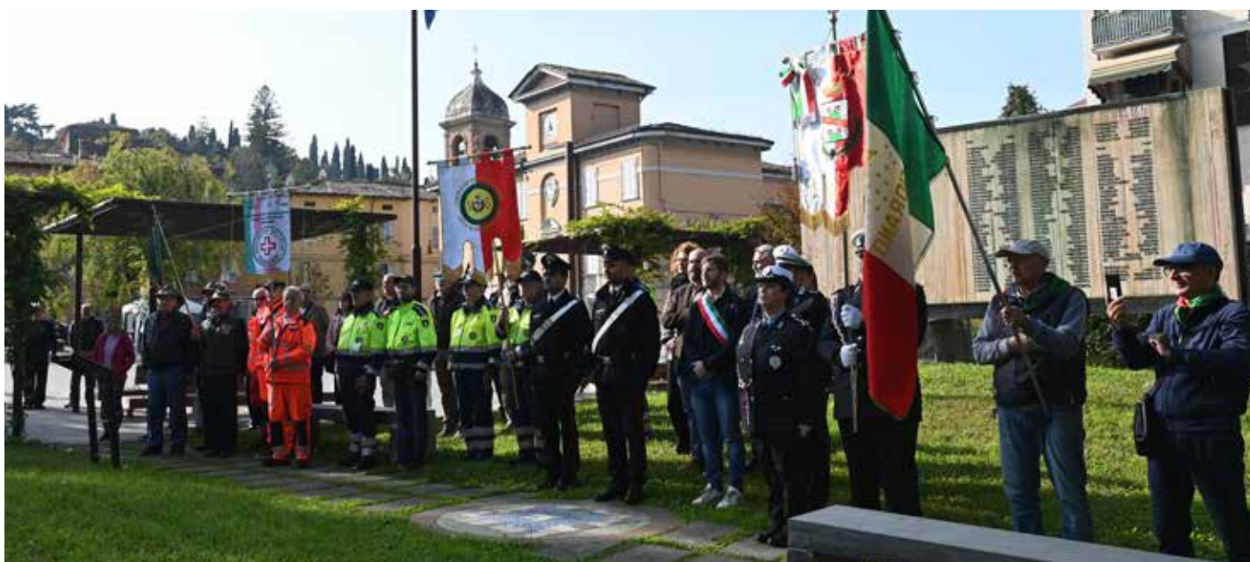
Domenica 3 novembre 2024 si sono svolte a Fiorano Modenese le celebrazioni per la Giornata dell'Unità Nazionale e delle Forze Armate